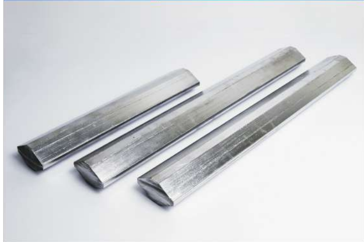
電鍍陽極棒 Electroplating Anode Bar