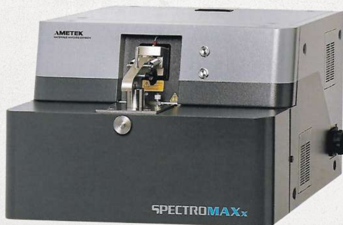
▲ SPECTROMAX xLMX09 火花放電光譜分析儀