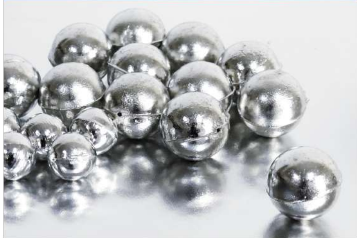
電鍍陽極錫球 Electroplating Sphere Anode