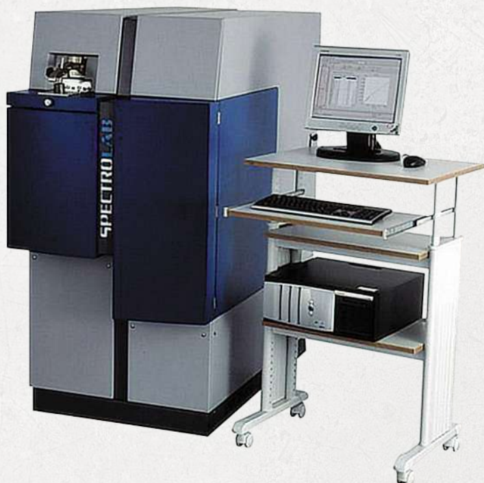
▲ Technical Data SPECTRO LAB

我們從原物料進貨、製程，至最終的產品檢驗，皆以專業化的品管人員，專注於各項產品的品質管制，並配備德國精良檢測儀器，以確保品質符合各國標準規格，如CNS、JIS、QQS、ASTM...等。